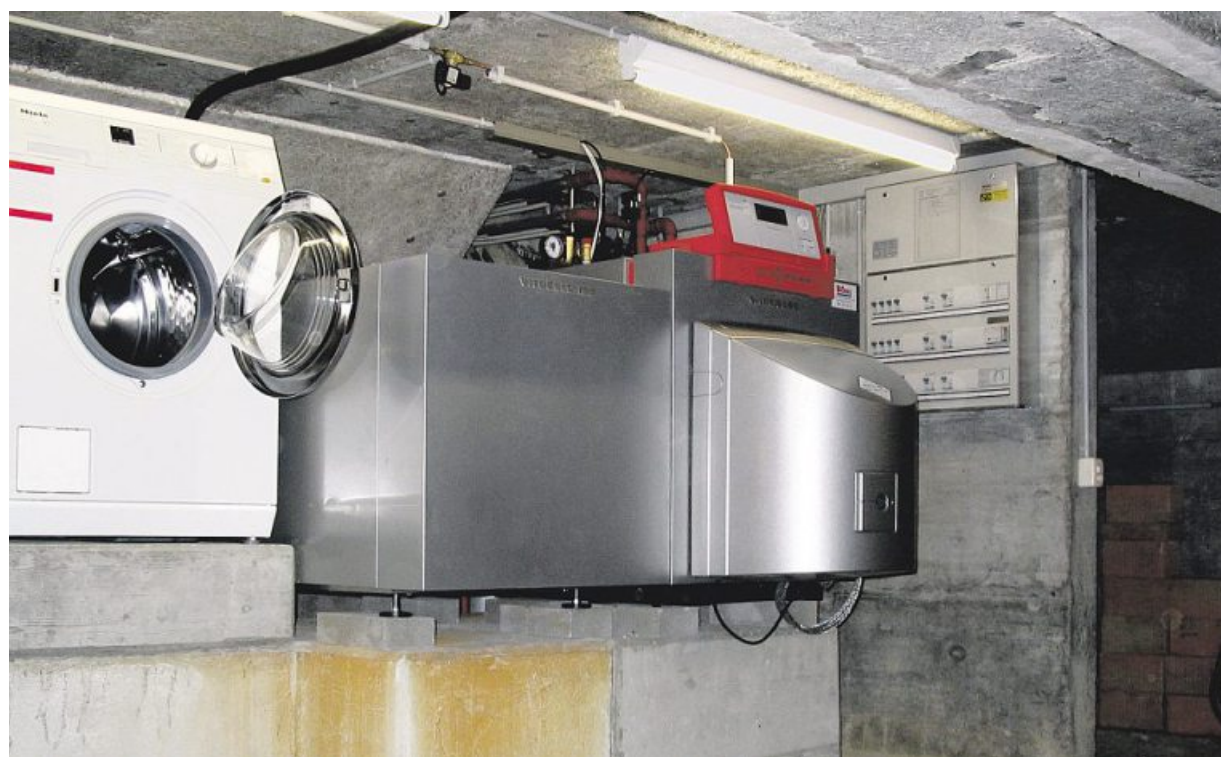
Avec un assainissement énergétique : surélever le chauffage et le tableau électrique pour prévenir des dégâts d'eau.