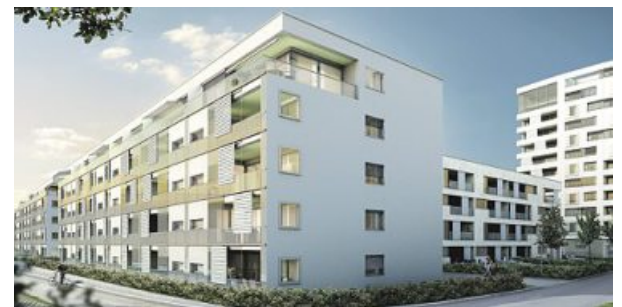
Minergie et qualité d'habitat dans le lotissement Selve à Thoune.

Vous trouverez des informations sur les cours et sur l'engagement climatique de l'AIB sous www.wwf.ch/haussanierung et www.aib.ch/climatique