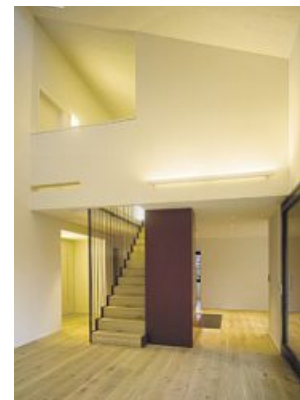
La pièce maîtresse de l'appartement agrandi : l'espace de séjour à haut plafond.