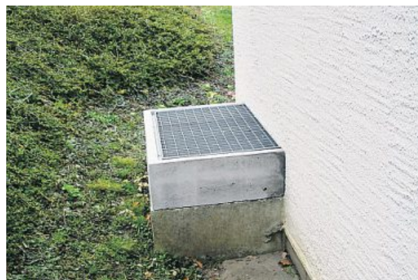
Des soupiraux surélevés protègent contre des dégâts d'eau.