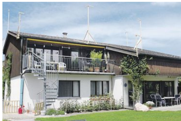
Avant la transformation, le toit descendant très bas bloquait une bonne partie de la lumière du jour.

l'amélioration de l'efficacité énergétique. En agrandissant les combles, l'appartement du haut a gagné une chambre. L'étage sous le toit s'est enrichi de quatre pièces et de