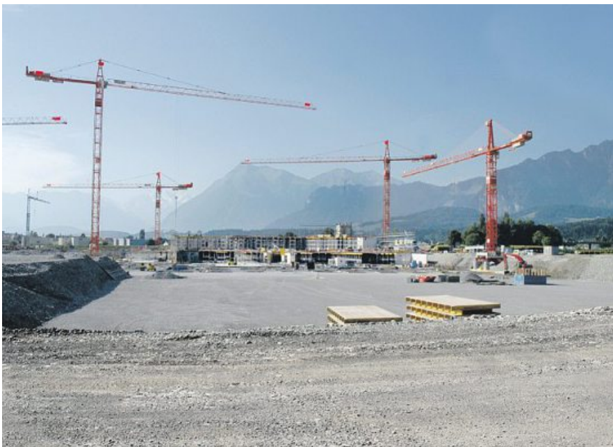
Il n'est encore guère visible, mais le stade est déjà assuré par l'AIB.

Vous trouverez plus d'informations relatives à l'assurance des travaux en cours sous www.aib.ch (rubrique Assurer)