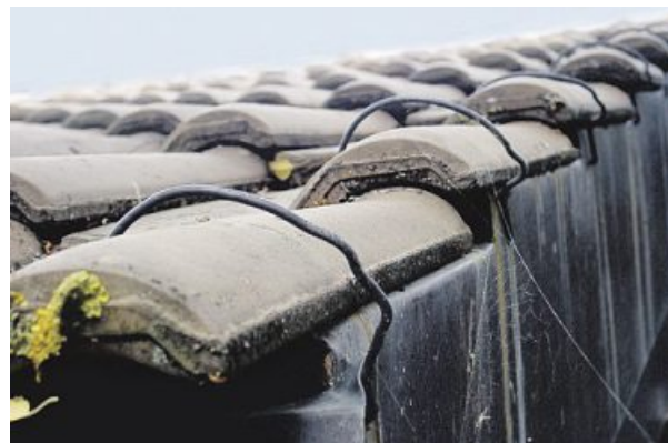
Mesure efficace : pince sur des tuiles contre les vents tempétueux.

Vous trouverez plus d'informations sous www.aib.ch/fondation-de-prevention