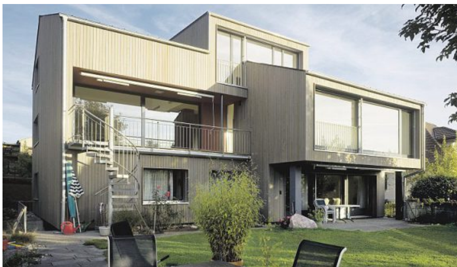
De grandes baies vitrées marquent la façade sud de la maison transformée.

À Grosshöchstetten, l'immeuble des années 1970 abritant deux générations était devenu trop petit pour la famille Sutter. Il était mal isolé et consommait trop d'énergie. Après les travaux, il convainc par son concept spatial généreux et le standard Minergie.