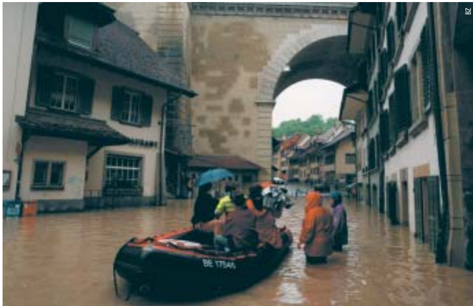
En 1999, des précipitations persistantes ont transformé le quartier bernois de Matte en une « Venise fédérale ».

Les dommages dus aux éléments naturels ont augmenté au cours des dernières années et un inversement de tendance est peu probable. Les propriétaires d'immeubles ne sont cependant pas démunis face aux événements naturels. De nombreux dommages peuvent être limités, voire empêchés grâce à des mesures simples et appropriées.