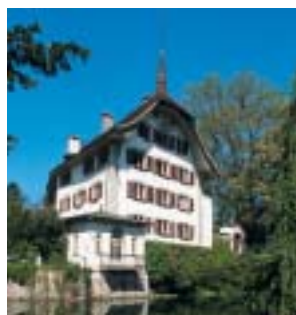
Ce ne doit pas être un château.

[i] Les images de qualité insuffisante ou les copies non autorisées ne seront pas publiées. Les participants donnent leur consentement à la reproduction gratuite de leurs photos dans les publications de l'AIB et de l'Espace Media Groupe, sans limitation dans le temps.