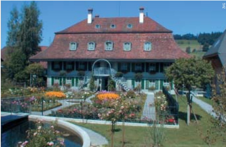
Un bien culturel a été préservé : l'auberge « Kreuz » à Dürrenroth.