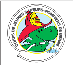
Grisu – la mascotte des jeunes sapeurs-pompiers.