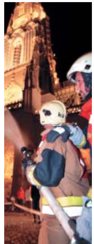
L'eau de l'Engstlige jaillit sur la Münsterplatz.

Vers 20 heures 45, après avoir parcouru 56 kilomètres, l'eau de l'Engstlige jaillissait sur la Münsterplatz de Berne.