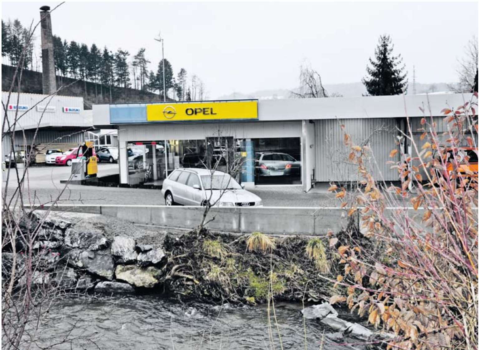
Pour que la Langete reste dorénavant dans son lit: un mur de béton long de 55 mètres.

Que ce soit au bord d'une rivière ou d'un lac, que l'on soit homme d'affaires ou quidam, les crues sont toujours un cauchemar. Si c'est l'entrepreneur qui est touché, les flots détruisent non seulement son chez-soi, ils menacent souvent l'existence même des victimes.