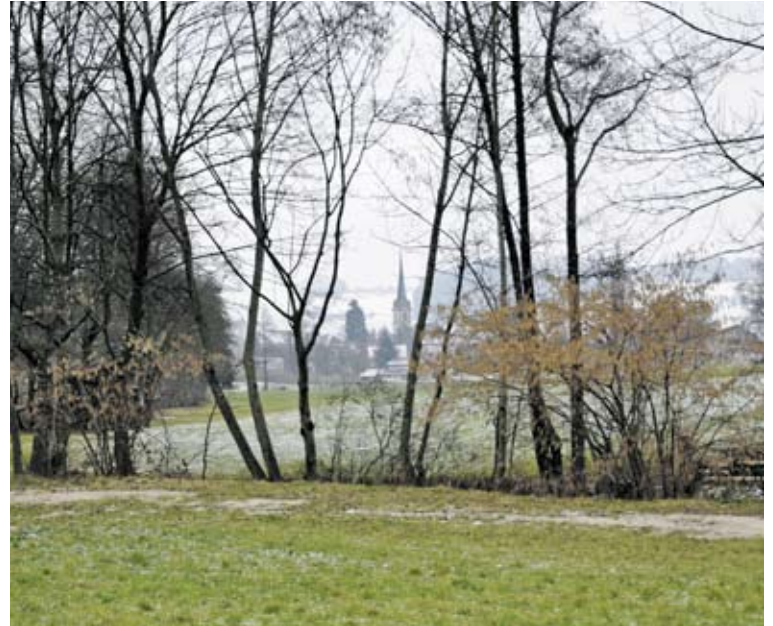
La Langete venant de Rohrbach.