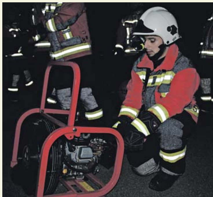
Combattre la fumée avec le ventilateur à grand rendement.

L'obturation mobile de protection contre la fumée fait partie de la lutte moderne contre les incendies. Elle permet aux forces d'intervention d'entrer dans un local en feu, sans que la fumée d'incendie brûlante et nocive ne se déplace pour autant dans des locaux encore intacts. L'obturation mobile de protection contre la fumée est d'habitude composée d'une toile ignifuge, fixée sur une barre métallique. Cette barre se bloque dans le cadre de la porte, de telle sorte que le tissu qui pend obture l'ouverture de la porte, même quand on ouvre cette dernière.