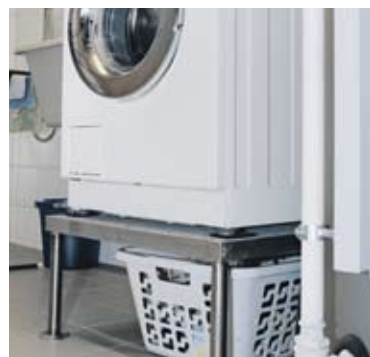
Bien protégé sur un support.