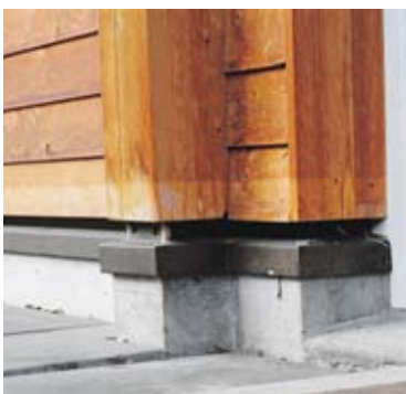
Les témoins de l'inondation : les décolorations du bois.

Malgré son impatience fort compréhensible, Hutzli a toujours à nouveau su regarder la situation sous l'angle de l'AIB. « Un examen critique est judicieux, car l'AIB est en fin de compte une assurance qui te rembourse les dégâts, mais non la rénovation de ta maison », conclut Hutzli philosophe. ▶