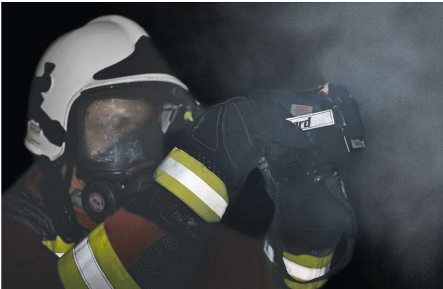
En cas de mise en œuvre immédiate sur les lieux d'un incendie, la caméra thermique est un instrument important pour sauver des vies et minimiser les dommages.

Avec l'entrée en vigueur des nouvelles instructions cantonales bernoises pour les sapeurs-pompiers (ISP) le 1 er janvier dernier, les exigences minimales des organisations de sapeurs-pompiers ont été étendues. L'objectif des nouvelles directives est d'augmenter l'efficacité des forces d'intervention.