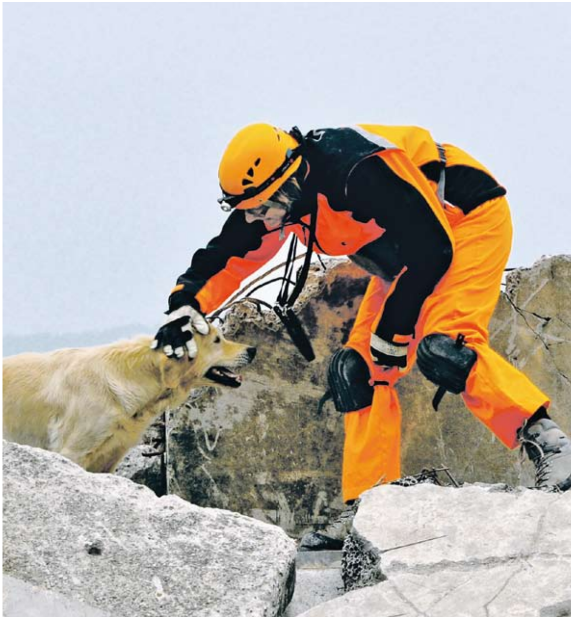
La truffe du chien, le meilleur instrument de localisation : depuis 40 ans, REDOG forme avec succès des chiens pour la recherche de victimes.

L'Association suisse des chiens de recherche et de sauvetage, REDOG, fête cette année son 40 e anniversaire. Une manifestation de jubilé en juin prochain sur la place de l'Orphelinat à Berne donne un aperçu du travail des conducteurs de chiens.