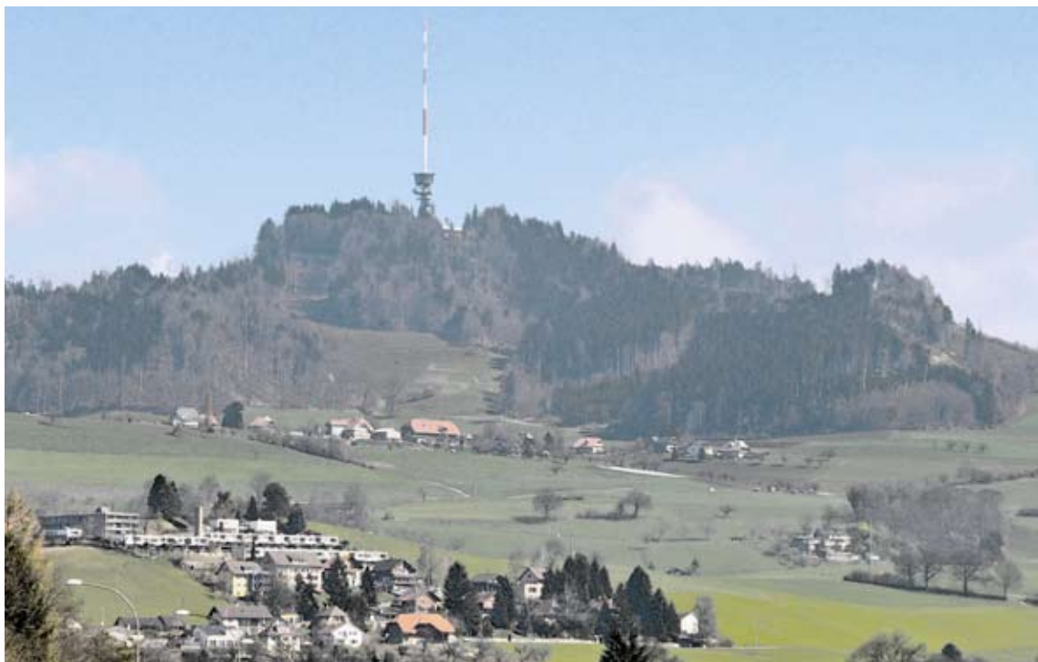
Bien assurée: en 1997, la station sur le Bantiger prend la relève de la tour haute de 60 mètres érigée en 1954.

Les tours de transmission sont assurées chez l'AIB comme objets appartenant à la catégorie « installations polyvalentes avec tour de transmission ». L'AIB assure les dommages subis par les immeubles sous la tour ou par la tour elle-même, mais non pas les équipements de transmission. Ces derniers sont considérés comme étant des équipements d'exploitation et sont le plus souvent assurés par des assurances privées.