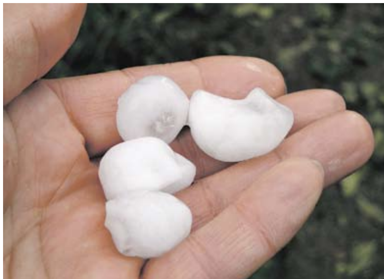
Dégâts garantis : des grêlons de cet acabit possèdent un pouvoir destructeur immense.

L'été approche et avec lui, la probabilité d'orages et de tempêtes de grêle. Lisez ici ce que vous pouvez faire pour protéger votre immeuble contre la grêle.