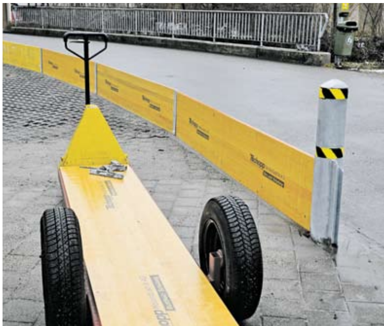
Rapidement installées: des mesures de protection mobiles.