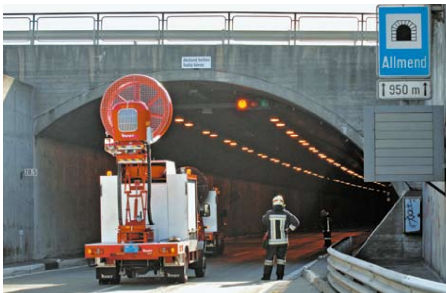
Sauver plus vite et plus efficacement avec les grands ventilateurs mobiles.