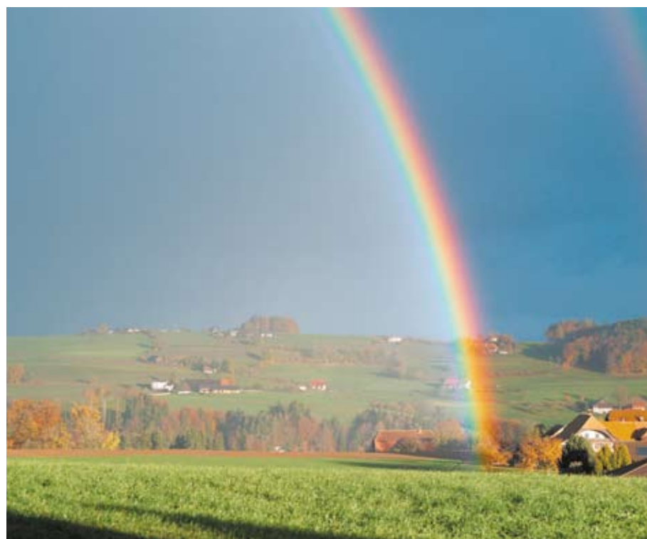
Intempéries – un spectacle naturel impressionnant riche en potentiel de danger.

des deux derniers siècles. Les dégâts immobiliers causés par des événements naturels, tels que tempêtes, grêle ou inondations ont augmenté de 50 % par décennie ces derniers temps. L'AIB estime que les dommages naturels atteindront CHF 950 millions entre 2001 et 2010.