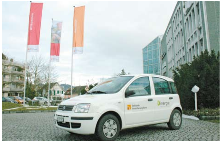
Moins de gaz d'échappement: l'AIB roule en voiture électrique.

L'engagement de l'AIB a été récompensé par le label de qualité de protection climatique d'argent « CO 2 -optimisé » décerné par SwissClimate.