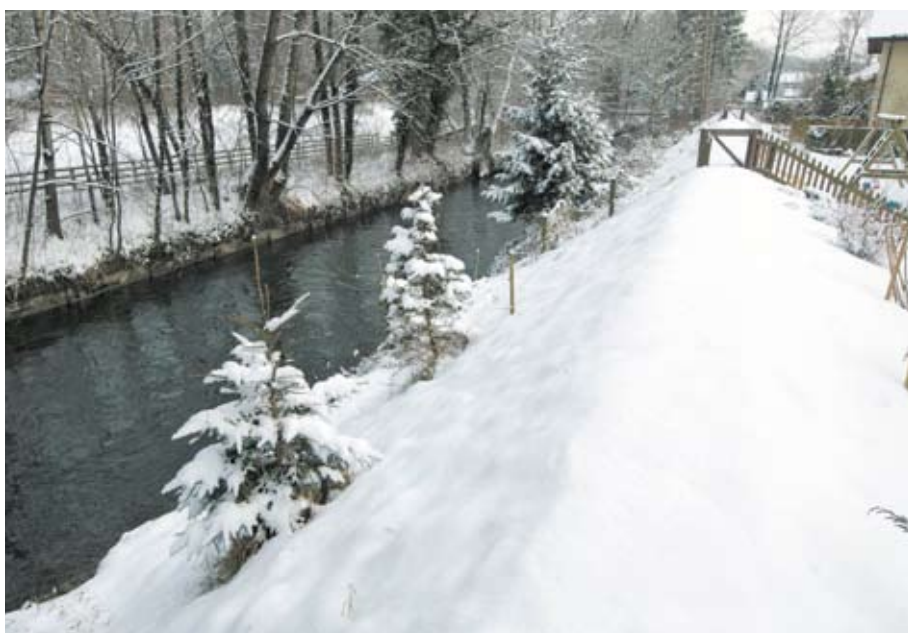
La digue qui sépare le terrain des Siegenthaler du canal a été exhaussée après les crues de 2007.