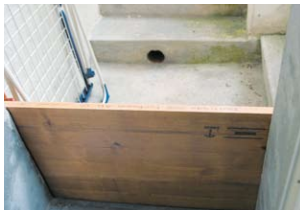
Au niveau de l'escalier de la cave aussi, Urs Siegenthaler a entravé l'accès de l'eau: un muret au haut de l'escalier et deux curseurs en bois retiennent l'eau au cas où.

fait aplanir le sol au niveau du rez-de-chaussée. En outre, le terrain a été doté d'un mur de protection. Un autre mur recouvre l'escalier de la cave. Finalement, un curseur en bois au haut de l'escalier de la cave et un autre près de la porte de la cave garantissent une protection supplémentaire. Toutes ces mesures ont coûté quelque 25 000 francs au total, la Fondation bernoise pour la prévention des dommages immobiliers en assumant une partie.