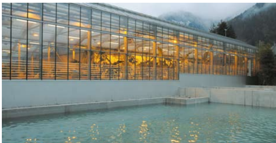
La Maison tropicale occupe une position dominante en ce qui concerne l'exploitation d'énergies renouvelables.

Plus d'infos sous : www.tropenhaus-frutigen.ch/fr