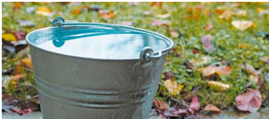
L'assurance dégâts d'eau-bâtiments de l'AIB : prestations de services complètes à une seule enseigne.

Une des compétences clé de l'AIB est la gestion de dommages de grande envergure. Elle dispose à cet effet d'un grand nombre de spécialistes aussi bien internes qu'externes. En période calme, les compétences et les ressources ne sont pas exploitées intégralement. Winzenried cite un exemple : « en 2008, une année pauvre en sinis-