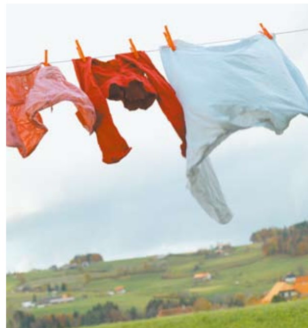
Le défi de l'avenir : le changement des conditions climatiques.

Autres conseils d'assurance : www.aib.ch