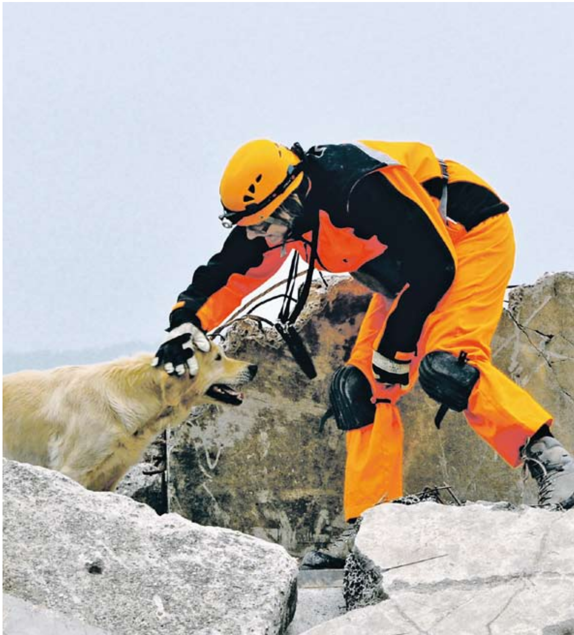
Die Hundenase ist das beste Ortungsmittel: REDOG bildet seit 40 Jahren erfolgreich Rettungshunde für die Trümmer- und Geländesuche aus.

Der Schweizerische Verein für Such- und Rettungshunde REDOG feiert dieses Jahr sein 40-jähriges Bestehen. Ein Jubiläumsanlass auf dem Berner Waisenhausplatz im Juni 2011 gibt Einblicke in die Arbeit der Hundeführer.