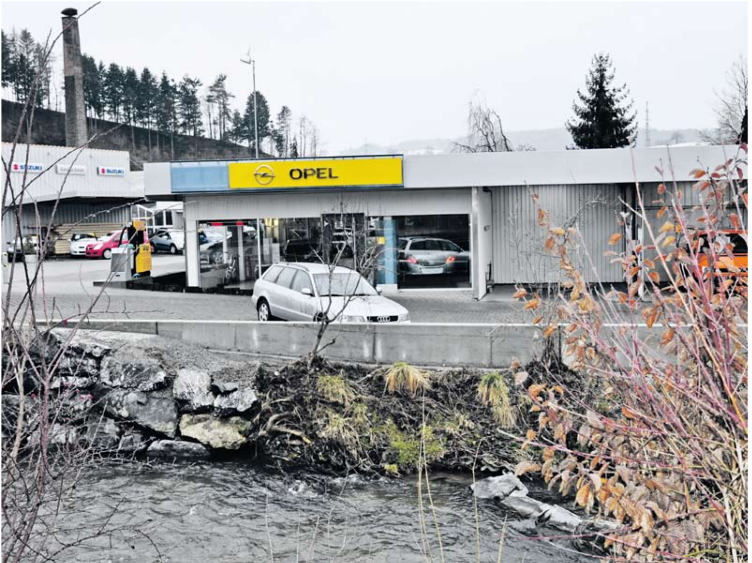
Damit die Langete bei künftigen Hochwassern im Bachbett bleibt: 55 Meter lange Betonmauer.

Ob an einem See oder einem Fluss, ob als Privatperson oder Geschäftsmann, Hochwasser ist in jedem Fall ein Albtraum. Ist der Unternehmer betroffen, zerstört die Flut aber nicht nur das traute Heim, sondern gefährdet oft eine ganze Existenz.