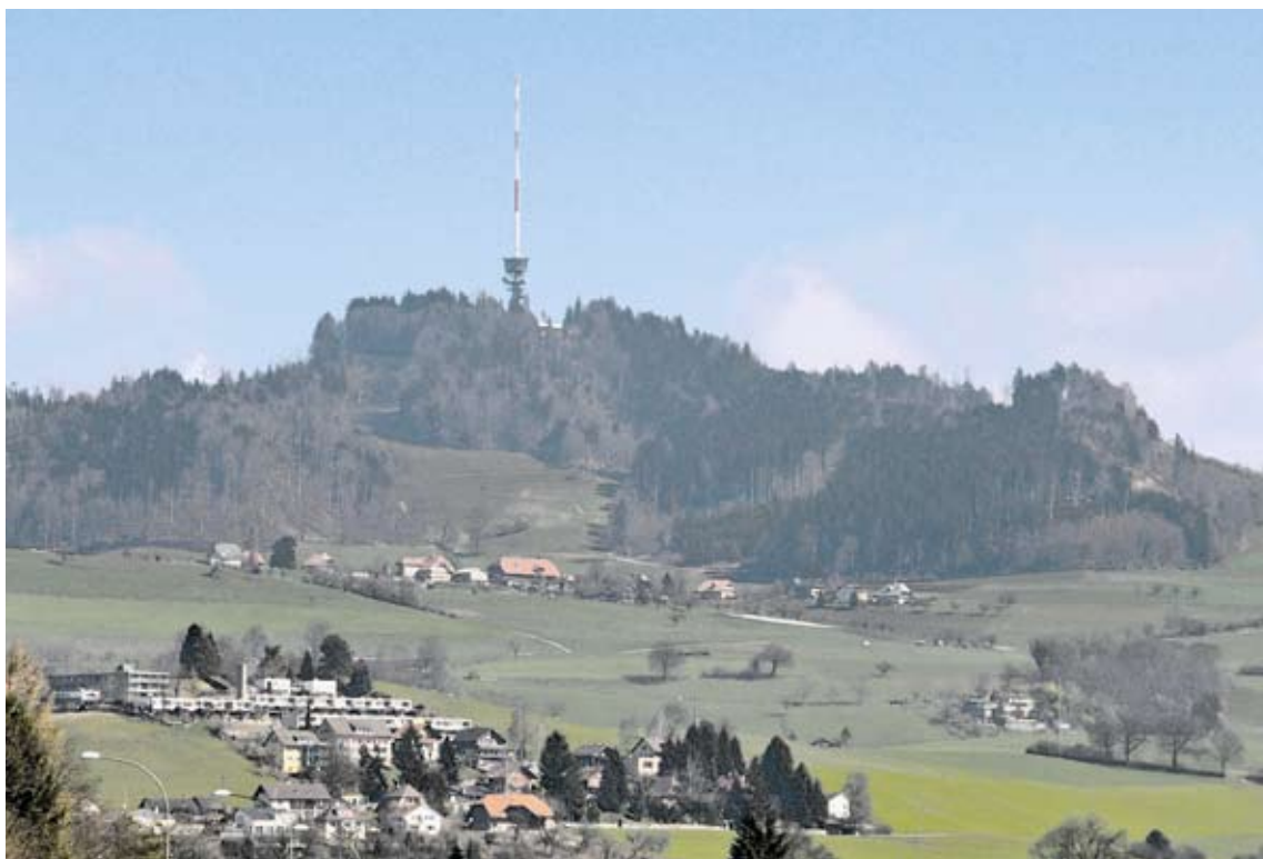
Gut versichert: 1997 löst die Station auf dem Bantiger den 60 Meter hohen Turm aus dem Jahr 1954 ab.

Sendetürme sind bei der GVB unter dem Begriff «Mehrzweckanlage mit Sendeturm» versichert. Die GVB deckt Schäden an Gebäuden unter oder am Sendeturm, nicht aber Schäden an den Sendeanlagen. Diese gelten als betriebliche Einrichtung und werden in der Regel von der Privatassekuranz versichert.