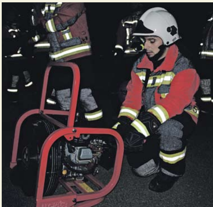
Kampf dem Rauch mit dem Überdruckbelüfter.

Der mobile Rauchverschluss gehört zur modernen Brandbekämpfung. Er ermöglicht es den Einsatzkräften, einen brennenden Raum zu betreten, ohne dass der heisse und giftige Brandrauch in andere, noch unverrauchte Räume dringt. Der Rauchverschluss besteht in der Regel aus einem nicht brennbaren Tuch, das an einer Metallstange befestigt ist. Diese wird im Ernstfall in den Türrahmen gespannt, wodurch das herabhängende Tuch die Türöffnung verschliesst, selbst wenn die Türe geöffnet wird.