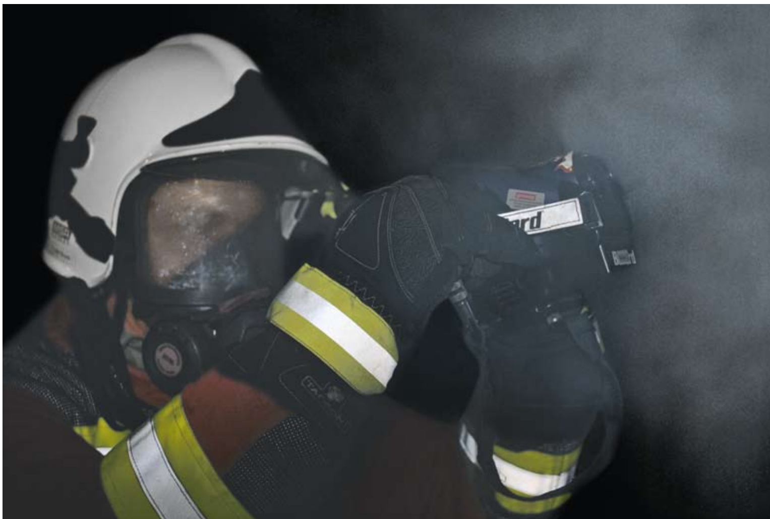
Bei sofortigem Einsatz am Brandort ist sie ein wichtiges Hilfsmittel, um Leben zu retten und Schäden zu minimieren: die Wärmebildkamera.

Mit Inkrafttreten der neuen kantonalbernischen Feuerwehrweisungen (FWW) per 1. Januar 2011 wurden die Mindestanforderungen an die Feuerwehrorganisationen im Kanton Bern erweitert. Ziel der neuen Weisungen ist es, die Effizienz der Einsatzkräfte zu erhöhen.