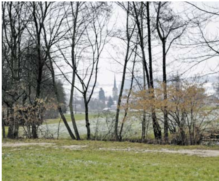
Langete von Rohrbach her kommend.