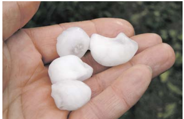
Schäden garantiert: Hagelkörner in dieser Grösse verfügen über ein immenses Schadenpotenzial.

Der Sommer naht und mit ihm die Wahrscheinlichkeit von Gewittern und Hagelschauern. Was Sie tun können, um Ihr Gebäude gegen Hagel zu schützen, erfahren Sie hier.