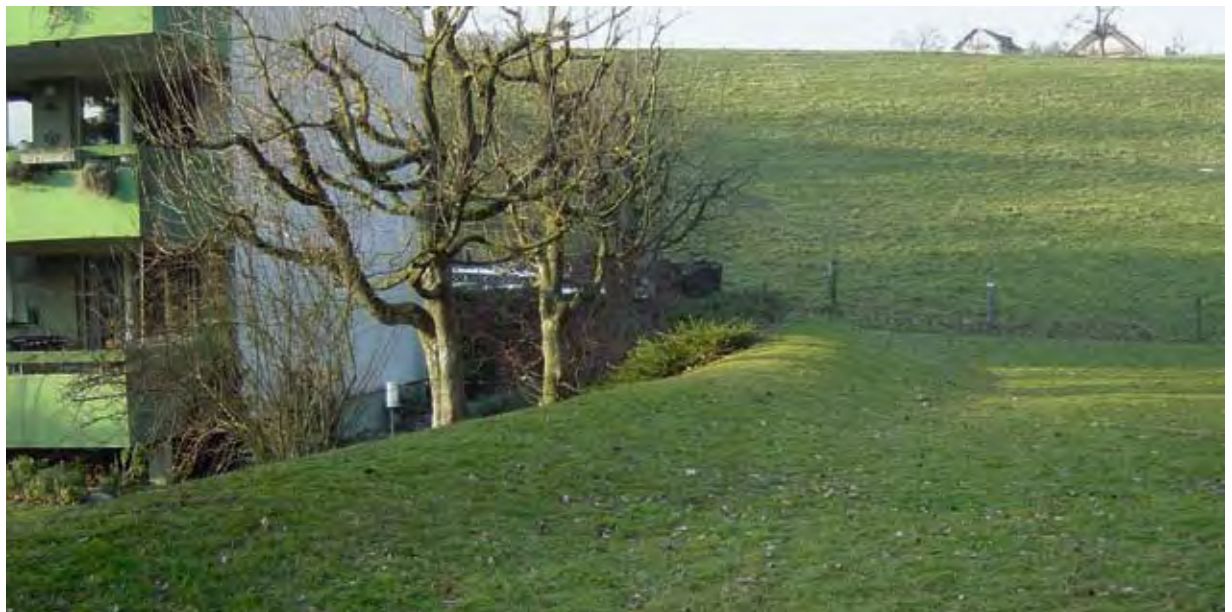
Erdwälle wie hier im Bild leiten das Wasser bei Unwetter vom Gebäude weg.

legung des Gebäudes geschehen oder durch Erdwälle, die das Wasser ableiten. Bei den Schutzmassnahmen dieser Kategorie ist es wichtig, die Umgebung der Liegenschaft ins Schutzkonzept mit einzubeziehen, damit das Wasser nicht beispielsweise zum nächsten Nachbarn umgeleitet wird.