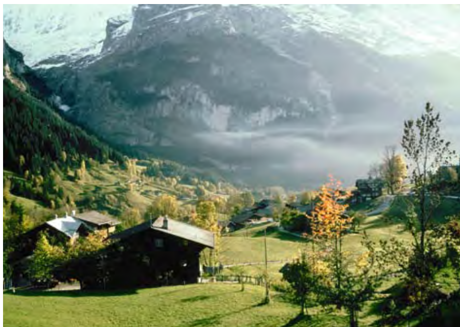
Der Schutz vor Elementarereignissen wird immer wichtiger – gerade auch in den Alpen, wo starke Gefälle und Unwetter häufig vorkommen.

die ihre Eigenverantwortung wahrnehmen, indem sie ihr Gebäude vor Elementarschäden schützen. Dass dieser Schutz heute dringender denn je ist, zeigt allein schon die Statistik: Die drei schlimmsten Schadenjahre in ihrer 200-jährigen Geschichte zeichnete die GVB in den letzten acht Jahren anlässlich der Hochwasser und Unwetter von 1999, 2005 und 2007. Die Frequenz heftiger Elementarereignisse steigt: Aus Jahrhunderthochwassern werden Jahrzehnt- oder gar Jahrfünfhochwasser. Die Gefahr ist real – und es kann jeden treffen. Der Kanton Bern ist aufgrund seiner Lage und seines Wasserhaushalts verstärkt betroffen. Hier befindet sich der höchste Teil der Alpen – ein Hochgebirge, wo reichlich Niederschläge fallen.