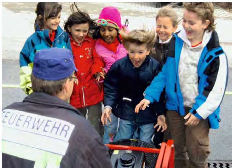
Der Ventilator bläst Rauch weg – und sorgt hier für eine Menge Spass!