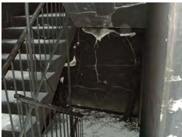
Mangels Schleuse verwüsteten Flammen und Rauch diese Treppenanlage und machten sie für die Bewohner unpassierbar.