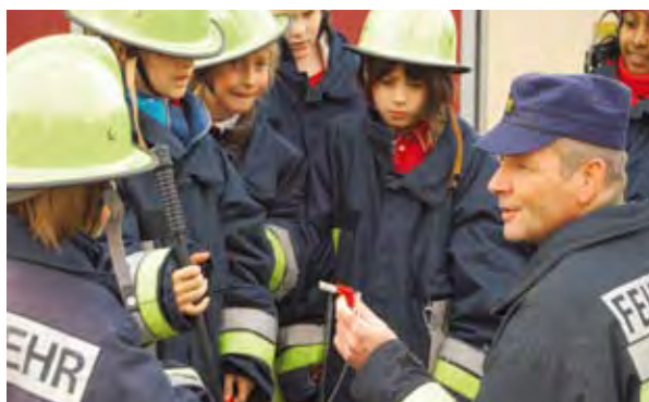
Warum der Feuerlöscher verplombt sein muss – jetzt wissen es die Kinder.

schäden zu vermeiden. Dass es je nach Brandart verschiedene Methoden gibt, die Flammen zu ersticken. Sie erleben, wie starke Ventilatoren Rauch wegblasen können – und einem die Haare zu Berge stehen lassen! Und dann stürzen sich die Kinder voller Enthusiasmus auf Feuerlöscher und Spritzen, um selbst auszuprobieren, wie es geht.