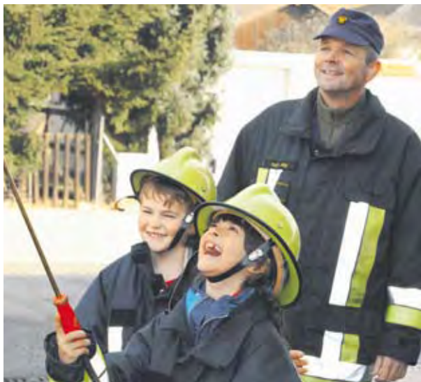
Natürlich darf jedes Kind auch einmal selbst an die Feuerwehrspritze.